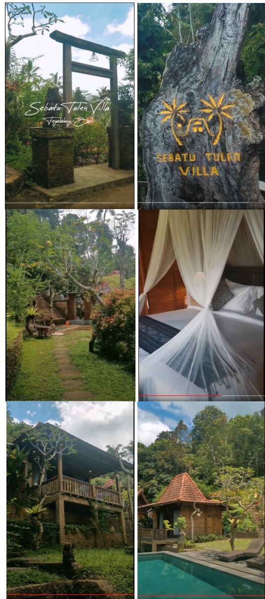
Gambar 4. Potongan scene video akhir

Setelah mendapatkan potongan video, dilakukan penggabungan dan pengeditan dalam proses credit scene . Saat ini dihasilkan 10 – 15 video dengan durasi pendek sekitar 2-5 detik dan telah dihasilkan 1 video profil Villa Sebato Tulen, dapat diakses pada link: https://drive.google.com/file/d/1fm_I6O2hbZ1rYFgOpYO5lhwIspmcc3zb/view?usp=share_link .