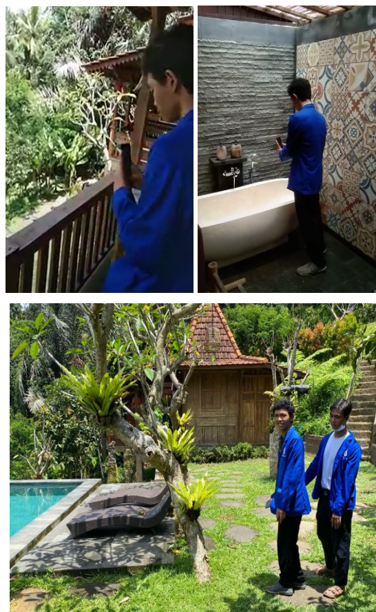
Gambar 2. Kegiatan Pengambilan Video

Aktifitas pertama adalah pengenalan teori dasar dalam pembuatan video profil dan video content pada social media seperti video Tik-Tok dan Instagram. Aktifitas pertama dimulai dari pukul 10:00 dan dilakukan selama 30 menit. Dalam aktifitas ini, dikenalkan kepada staf Villa Sebatu Tulen terkait perspektif video yang sekiranya dapat menambah engagement dan menambah pelihat ( viewer ). Tujuan dari pengenalan video adalah untuk memberikan pandangan terkait apa yang dapat dilakukan dalam pembuatan video profil di Sebatu Tulen.