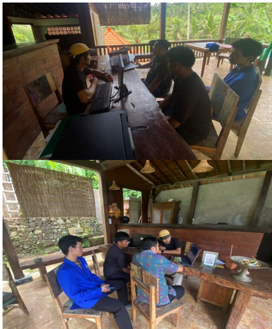
Gambar 3. Proses Credit scene

Beberapa fitur tambahan kamera yang dikenal adalah fitur ISO, focus: bokeh , panorama view dan filter effect . Selain pengenalan, staf di tunjukkan beberapa hasil pengambilan gambar dengan setiap fitur dengan tujuan untuk mengetahui kapan penggunaan dan kesesuaian kebutuhan pengambilan video dengan kualitas yang diinginkan.