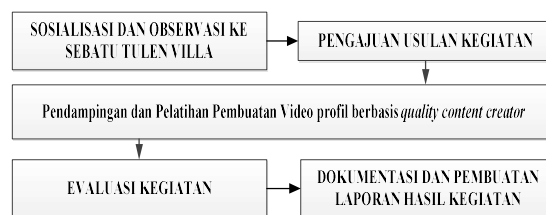
Gambar 2. Tahapan Pelaksanaan Kegiatan

Susunan kegiatan pengabdian yang dilaksanakan ditunjukkan pada Gambar 3.