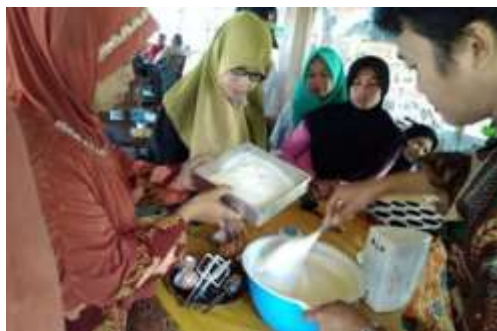
Gambar 6 Kegiatan pelatihan kelas memasak oleh Dinas Sosial Kabupaten Magelang

Program terakhir yang dilakukan dalam pengabdian ini adalah program Check , di mana peserta pelatihan diberikan kesempatan untuk mendiskusikan evaluasi kegiatan yang telah dilakukan. Dalam diskusi terdapat beberapa hal yang masih menjadi problema dalam paguyuban antara lain modal, model pemasaran dan keberlanjutan program wirausaha pada paguyuban warsamundung.