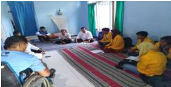
Gambar 1 Kegiatan survey mengunjungi Paguyuban Warsamundung bersama Perangkat Desa

Dusun Srikaton, RT.01/RW.05, Desa Ngablak, Kecamatan Srumbung, Kabupaten Magelang. Dengan adanya perintisan paguyuban kembali menyebabkan ketidakersediaan modal, menumbuhkan kembali optimisme, dibutuhkannya motivasi untuk membangun kewirausahaan.