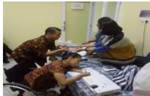
Gambar 4 Kegiatan FGD dengan pengurus Paguyuban Warsamundung

Pengelompokan yang dilakukan berdasarkan keterampilan yang dimiliki bertujuan untuk lebih memudahkan dalam mengajukan pendampingan pelatihan dari Dinas Sosial. Selain itu perencanaan yang dilakukan untuk mengembangkan paguyuban ini dapat berjalan dengan efektif dan efisien.