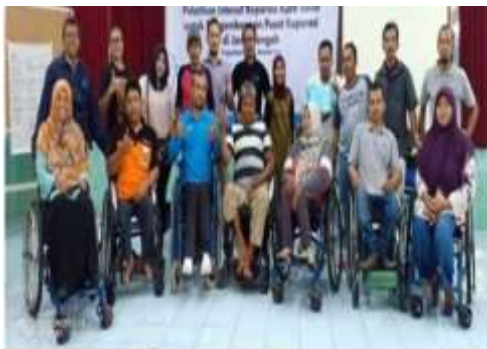
Gambar 5 Kegiatan pelatihan kelas reparasi kursi roda oleh Dinas Sosial Kabupaten Magelang

Program Do , dilakukan dengan melakukan pendampingan dalam mengembangkan kompetensi anggota paguyuban dengan bekerjasama dengan Dinas Sosial Kabupaten Magelang. Pendampingan ini dilakukan dengan melakukan workshop motivasi kewirausahaan oleh tim pengabdian dan pelatihan keterampilan paguyuban oleh Dinas Sosial Kabupaten Magelang.