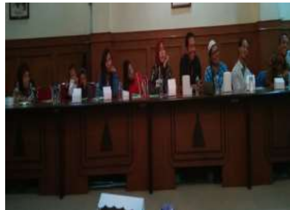
Gambar 7 Kegiatan diskusi untuk mengevaluasi kegiatan yang telah dilakukan

Program terakhir yang dilakukan dalam pengabdian ini adalah program Check , di mana peserta pelatihan diberikan kesempatan untuk mendiskusikan evaluasi kegiatan yang telah dilakukan. Dalam diskusi terdapat beberapa hal yang masih menjadi problema dalam paguyuban antara lain modal, model pemasaran dan keberlanjutan program wirausaha pada paguyuban warsamundung.