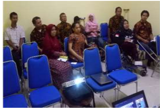
Gambar 3 Kegiatan FGD anggota paguyuban warsamundung.

Dari kegiatan FGD diketahui bahwa beberapa kegiatan pelatihan sudah dilakukan oleh Dinas Sosial antara lain pelatihan pembuatan kursi roda, memasak dan menjahit. Namun semua alat yang telah difasilitasi oleh Dinas Sosial sekarang sudah tidak dapat dimanfaatkan lagi karena adanya bencana erupsi Merapi di tahun 2010.