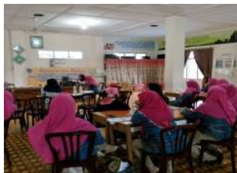
Gambar 3 Suasana Kegiatan Pelatihan Pembuatan Alat Pembelajaran Edukatif bagi Guru TK Aisyiyah