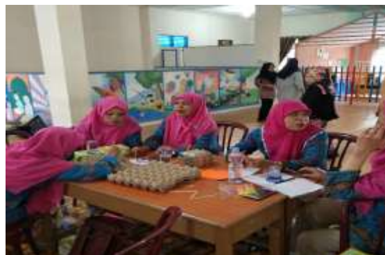
Gambar 5 Kelompok peserta guru sedang membuat alat pembelajaran edukatif untuk merangsang motorik halus dan motorik kasar anak pada kelompok belajar B (usia 5 - 6 tahun)

Para peserta diberi waktu 50 menit untuk menyelesaikan proyek kelompok mereka masing-masing yakni membuat alat pembelajaran edukatif.