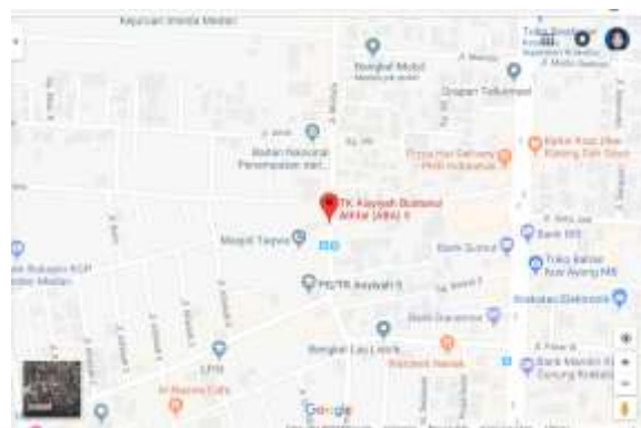
Gambar 1 Lokasi Pengabdian Masyarakat

Persiapan yang dilakukan untuk membimbing Taman Kanak-kanak Aisyiyah Bustanul Athfal di Kota Medan dilaksanakan dalam beberapa tahap guna mewujudkan para Guru Taman Kanak-kanak Aisyiyah kreatif, unggul dan cerdas serta meningkatkan profesionalisme Guru Taman Kanak-kanak Aisyiyah yang mahir di bidangnya. Kegiatan program PKPM “Pelatihan Pembuatan Alat Pembelajaran Edukatif untuk Meningkatkan Profesionalisme Guru TK Aisyiyah di Kota Medan” dilaksanakan pada Kamis, 12 Sya’ban 1440/18 April 2019 bertempat di AULA TK Aisyiyah Bustanul Athfal 5. Kegiatan pelatihan ini dihadiri oleh peserta yang berasal dari beberapa sekolah TK Aisyiyah Bustanul Athfal di Kota Medan. Jumlah peserta yang mengikuti kegiatan ini adalah 30 orang peserta yang diutus dari masing-masing sekolah.