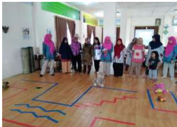
Gambar 6 Engklek Jebakan Misterius, salah satu nama alat pembelajaran edukatif yang berhasil kelompok peserta guru ciptakan