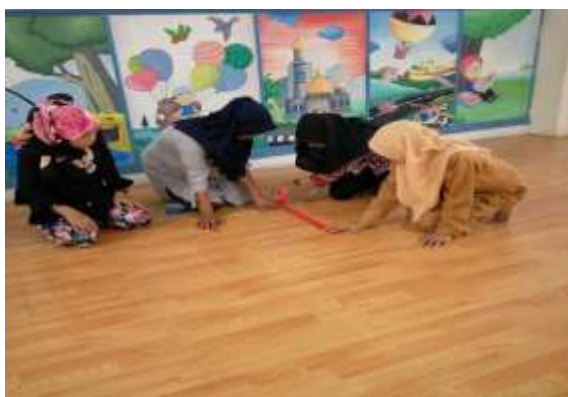
Gambar 4 Kelompok peserta guru sedang membuat alat pembelajaran edukatif untuk merangsang motorik halus dan motorik kasar anak pada kelompok belajar A (usia 4-5 tahun)

Para peserta diberi waktu 50 menit untuk menyelesaikan proyek kelompok mereka masing-masing yakni membuat alat pembelajaran edukatif.