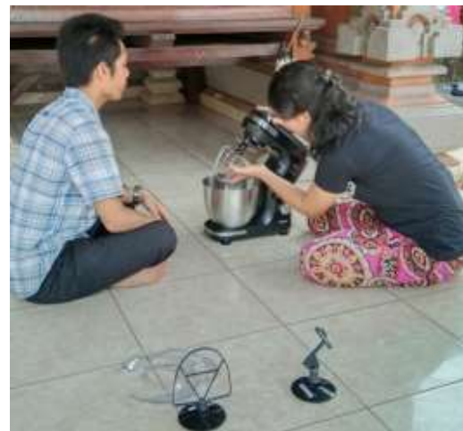
Gambar 6 Pelatihan Penggunaan Alat

Dalam pelatihan penggunaan alat produksi dilakukan tiga kali pertama pelatihan tanpa menggunakan bahan adonan, pelatihan kedua menggunakan bahan adonan 1 kilogram tepung, dan pelatihan ketiga