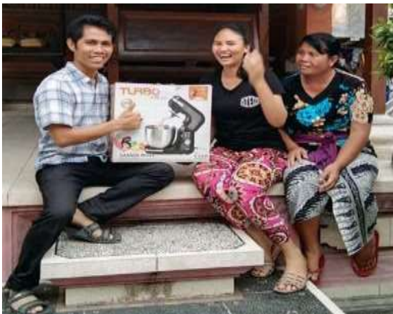
Gambar 5 Serah Terima Barang

Pembelian dan pemesanan alat produksi melibatkan team pengabdian bersama mitra langsung.