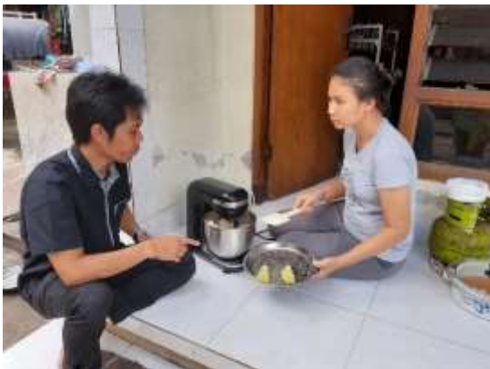
Gambar 7. Pengukuran waktu Produksi

Hasil evaluasi kegiatan pengabdian berupa wawancara yaitu berupa pernyataan mitra yaitu mitra memberikan pernyataan selain mempercepat proses produksi mitra juga diuntungkan dengan kemudahan dalam proses produksi dan mengurangi tingkat kelelahan mitra dalam mencampur adonan.