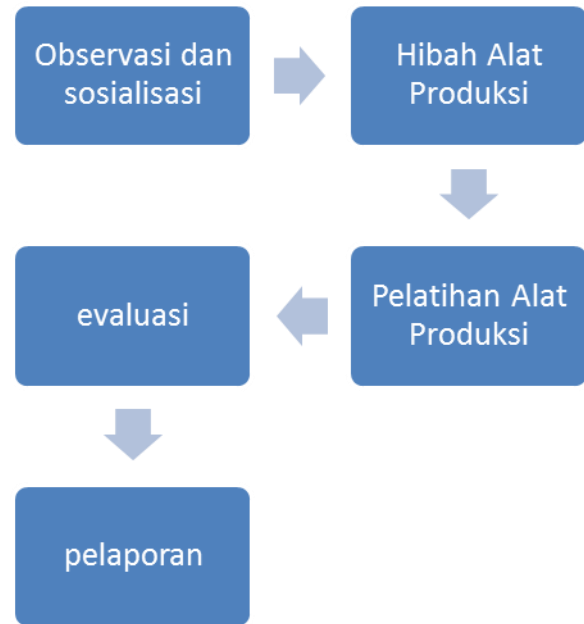
Gambar 4 Metode Kegiatan

Tahapan – tahapan dalam metode kegiatan ditunjukkan menggunakan Gambar 4 berikut: