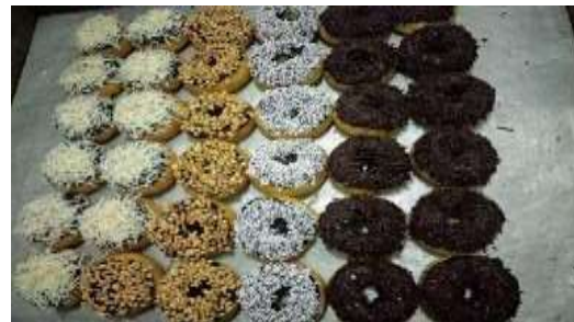
Gambar 3 Produk Mitra

adalah foto produk mitra yang sudah siap jual: