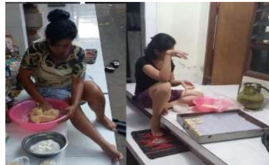
Gambar 2 Proses Produksi Donat Kentang