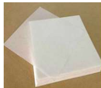
Gambar 3. Kerta Putih Pembungkus Nasi

Berdasarkan hasil diskusi, identifikasi, dan penilaian terhadap kemasan produk mitra terdapat beberapa hal yang perlu diperbaiki yaitu cara mengemas nasi putih dan belum adanya label pada kemasan. Sehingga diperlukan perbaikan kemasan dan label baru agar lebih menarik minat pembeli. Kemasan adalah alat komunikasi yang mengkaitkan bentuk, struktur, material, warna, citra, tipografi, dan elemen-elemen, desain dengan informasi produk agar produk dapat dipasarkan. Desain kemasan berlaku untuk membungkus, melindungi, mengirim, mengeluarkan, menyimpan, mengidentifikasi, dan membedakan sebuah produk di pasar (Klimchuck dan Krasovec, 2006). Sehingga tim pelaksana menambahkan pembungkus nasi putih dengan ukuran 20cm x 25cm seperti yang terlihat pada Gambar 3. Pembungkus nasi ini dapat dibeli dimanapun dengan harga cukup terjangkau. Pembungkus ini diharapkan dapat melindungi nasi putih dari minyak olahan cumi sehingga terlihat lebih menarik. Pada kegiatan pelatihan pengemasan telah dipraktekkan secara langsung bagaimana cara implementasi pembungkus nasi kepada mitra. Hasil penerapan pembungkus nasi dapat dilihat pada Gambar 4.