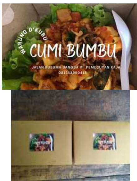
Gambar 5. Label Kemasan Mitra

Pada kegiatan selanjutnya dirancang label kemasan oleh pelaksana pengabdian. Label didesain menggunakan software online yaitu https://www.canva.com/ . Canva adalah aplikasi desain grafis online yang mudah untuk digunakan, sekalipun bagi pemula. Aplikasi web ini memiliki dua versi berbayar dan satu versi gratis. Label adalah salah satu sarana untuk melakukan branding. Di Canva terdapat berbagai macam template yang memudahkan pengguna untuk membuat label unik. Tim pelaksana merancang label berdasarkan hasil diskusi dengan Mitra. Label kemasan dibuat dengan ukuran 5cm x 8cm. Pada label kemasan terdapat nama mitra yang mudah diingat oleh masyarakat, alamat serta nomor telepon mitra yang dapat dihubungi. Hasil desain label kemasan dapat dilihat pada Gambar 5.