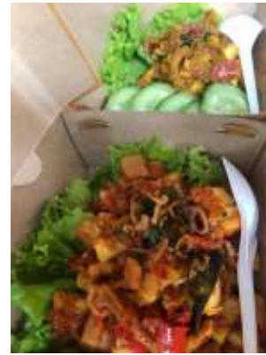
Gambar 1. Produk Mitra

Kemasan produk olahan masakan cumi saat ini hanya menggunakan kotak sederhana yang berwarna coklat, berbintik warna hitam. Kotak yang digunakan sangat rentan terhadap minyak sehingga mengurangi tampilan produk dan tidak menarik minat masyarakat. Produk yang dijual oleh mitra dapat dilihat pada Gambar 1. Pengemasan merupakan kegiatan merancang dan membuat wadah atau bungkus sebagai suatu produk (Kotler, 2003). Jadi kemasan adalah suatu kegiatan merancang dan memproduksi bungkus suatu produk yang meliputi desain bungkus dan pembuatan bungkus produk tersebut. Desain kemasan produk mampu mempengaruhi minat beli masyarakat (Christy, 2015). Pada kemasan produk olahan masakan cumi ini belum ada label usaha IRT sehingga identitas mitra tidak terlihat pada kemasan produk. Perbaikan kemasan merupakan strategi yang dapat diterapkan oleh pengusaha kecil dan mikro pada produk mereka. Namun demikian, perbaikan kemasan hanya merupakan salah satu elemen dari strategi produk, sehingga dampak dari kemasan terhadap keberhasilan pemasaran produk juga tergantung pada elemen bauran pemasaran lain, seperti distribusi dan promosi (Nugroho, 2019). Pada kemasan stik ale – ale dan stik kangkung juga telah dilakukan perbaikan dimana hasil kegiatan ini menunjukkan adanya peningkatan penjualan produk setelah perbaikan kemasan (Wardanu, 2018).