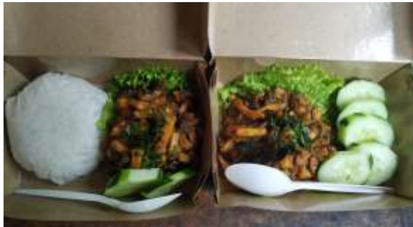
Gambar 4. Kemasan Baru Produk

Pada kegiatan selanjutnya dirancang label kemasan oleh pelaksana pengabdian. Label didesain menggunakan software online yaitu https://www.canva.com/ . Canva adalah aplikasi desain grafis online yang mudah untuk digunakan, sekalipun bagi pemula. Aplikasi web ini memiliki dua versi berbayar dan satu versi gratis. Label adalah salah satu sarana untuk melakukan branding. Di Canva terdapat berbagai macam template yang memudahkan pengguna untuk membuat label unik. Tim pelaksana merancang label berdasarkan hasil diskusi dengan Mitra. Label kemasan dibuat dengan ukuran 5cm x 8cm. Pada label kemasan terdapat nama mitra yang mudah diingat oleh masyarakat, alamat serta nomor telepon mitra yang dapat dihubungi. Hasil desain label kemasan dapat dilihat pada Gambar 5.