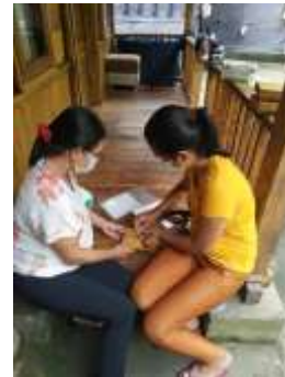
Gambar 6. Praktek Pelabelan

Pada saat pelatihan mitra juga diajarkan secara langsung implementasi label pada kemasan seperti yang terlihat pada Gambar 6.