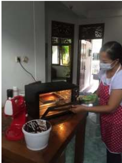
Gambar 4. Pengoperasian Peralatan Produksi Baru

Untuk membantu menangani permasalahan produksi pada mitra telah dilakukan penyerahan peralatan produksi, sehingga diharapkan dapat meningkatkan kapasitas dan hasil produksi. Berdasarkan hasil pengamatan setelah menggunakan peralatan produksi tambahan, hasil produksi mitra terjadi peningkatan seperti yang ditunjukkan pada Tabel 1.