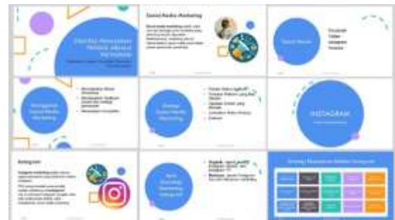
Gambar 6. Modul Pelatihan

Selain pelatihan pada kegiatan ini juga sekaligus pembuatan dan penyerahan logo baru pada usaha mitra. Proses pembuatan logo melibatkan mahasiswa seperti ditunjukkan pada Gambar 7 dan logo usaha baru yang dihasilkan ditunjukkan pada Gambar 8.