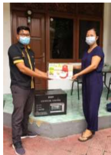
Gambar 3. Penyerahan Hibah Alat Produksi

Pelaksanaan pengabdian diawali dengan sosialisasi dan persiapan, kegiatan ini bertujuan untuk menggali permasalahan pada mitra dan mendiskusikan solusi yang diberikan tepat guna. Selanjutnya pemberian hibah alat – alat pendukung produksi produk mitra dan dilanjutkan dengan pelatihan pengoprasian alat produksi baru, seperti ditunjukkan pada Gambar 3 dan Gambar 4.