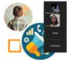
Gambar 5. Screenshot dari Pelatihan

Social media marketing adalah salah satu dari berbagai jenis marketing yang sekarang banyak digunakan. Sederhananya, marketing jenis ini memanfaatkan peran media sosial dalam proses pemasaran produknya