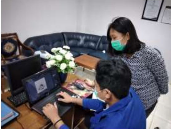
Gambar 7. Proses Pembuatan Logo