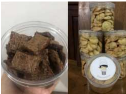
Gambar 1. Produk Unggulan Mitra

Cookies umumnya dikonsumsi sebagai makanan selingan dan dihidangkan saat hari raya besar keagamaan. Umumnya tepung terigu digunakan sebagai bahan dasar dalam pembuatan cookies . usaha yang dilakukan oleh Mitra cukup menjanjikan karena produk yang dihasilkan sangat diminati di masyarakat, terbukti dengan banyaknya permintaan atau pesanan setiap harinya mencapai belasan toples. Produk unggulan mitra yang memiliki permintaan cukup banyak yaitu Cornflakes cookies dan Brownies cookies . Seperti ditunjukan pada Gambar 1.(Nurbaya and Estiasih, 2013)