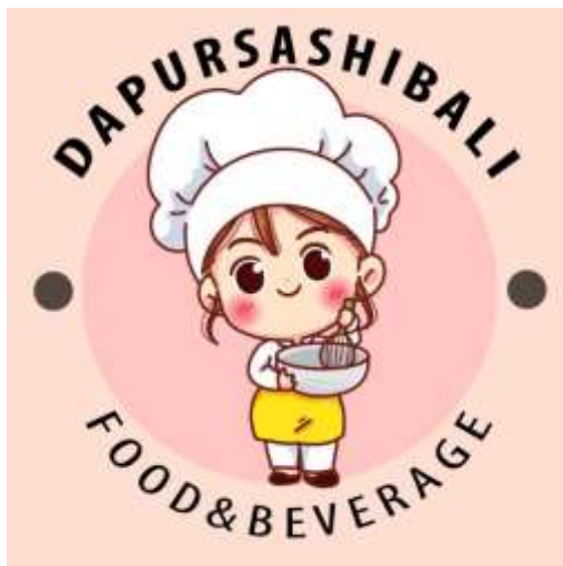
Gambar 8. Logo Usaha Baru

Setelah melakukan evaluasi terhadap kegiatan pelatihan pemasaran dan penyerahan logo hasilnya mitra memahami strategi memasarkan produk melalui media sosial Instagram dan mitra telah memiliki logo usaha baru untuk meningkatkan branding produk.