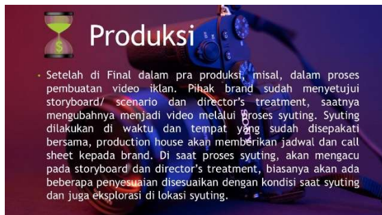
Gambar 15. Materi Pelatihan Multimedia