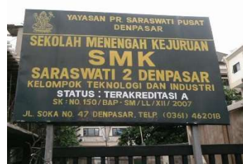
Gambar 3. SMK Saraswati 2 Denpasar

Adapun situasi tempat mitra seperti pada gambar 3 sampai gambar 5