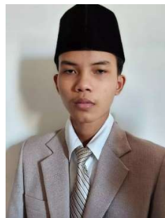
Gambar 1. Contoh Foto Pertama

Berikut adalah gambaran awal dari kurang maksimalnya hasil produk yang dibuat oleh siswa-siswa SMK Saraswati 2 Denpasar, dimana sumber foto yang diambil merupakan foto-foto yang ikut berpartisipasi dalam lomba foto pahlawan yang diadakan oleh OSIS sekolah tahun 2021.