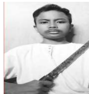
Gambar 2. Contoh Foto Kedua

Dari gambar 1 dan 2 terlihat kekurangan produk foto dari kualitas pencahayaan, objek foto yang terlalu melebar atau tidak proporsional dan pasca produksi berupa editing pewarnaan.