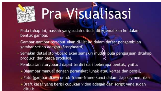
Gambar 13. Materi Pelatihan Multimedia