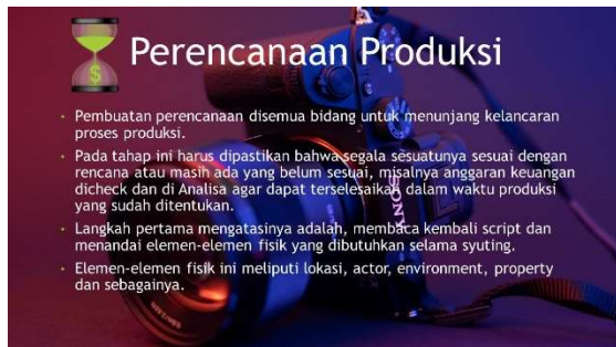
Materi 14. Materi Pelatihan Multimedia