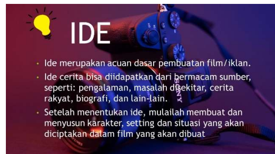
Gambar 10. Materi Pelatihan Multimedia