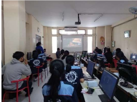
Gambar 7. Pelatihan multimedia foto dan Video

kegiatan memberikan kembali posttest kepada peserta pelatihan. Program kegiatan terlaksana di tanggal 22 Desember 2021 jam 09.00 -11.00 yang terlihat pada gambar 7 dan gambar 8.