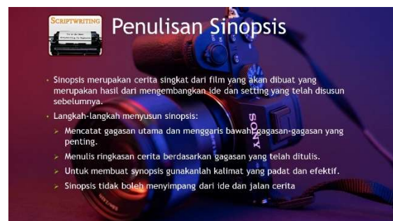
Gambar 11. Materi Pelatihan Multimedia