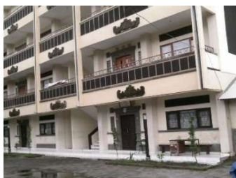
Gambar 4. Suasana SMK Saraswati 2 Denpasar