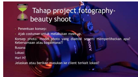
Gambar 17. Materi Pelatihan Multimedia