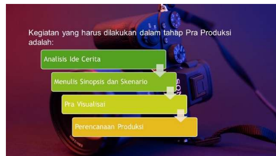
Gambar 9. Materi Pelatihan Multimedia

Hasil evaluasi kegiatan pelatihan multimedia foto dan video berbentuk kuisioner yang direspon oleh semua peserta Pelatihan multimedia adalah seratus persen peserta sangat antusias dan puas dengan pelatihan ini sehingga dalam pelaksanaan program pelatihan, peserta tidak menemui kendala untuk memahami materi pelatihan berupa tahap produksi project videografi dan fotografi, tahap project photography-beauty shoot , editing foto dan editing video. Gambar 9 - 17 dibawah ini merupakan garis besar materi pelatihan yang dibawakan oleh pembicara dalam bentuk powerpoint.