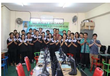
Gambar 5. Suasana SMK Saraswati 2 Denpasar