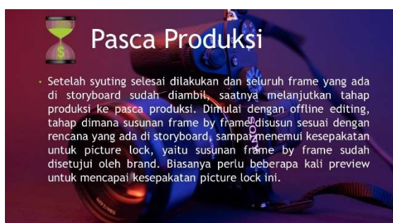
Gambar 16. Materi Pelatihan Multimedia

Hasil diskusi dari pemaparan materi pelatihan telah dirangkum seperti tertera pada tabel 1.