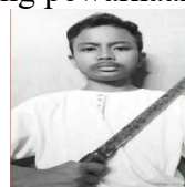
Gambar 18. Produk Foto Sebelum Pelatihan Multimedia

Selain luaran dari hasil test pelatihan, peserta juga membuat produk berupa foto untuk menerapkan materi pelatihan multimedia seperti tertera pada gambar 18 & 19. Hasil produk mengalami peningkatan kualitas dari produk sebelum dilaksanakan pelatihan ini berupa kualitas pencahayaan, komposisi foto dan pasca produksi berupa editing pewarnaan(Maryono, 2017).