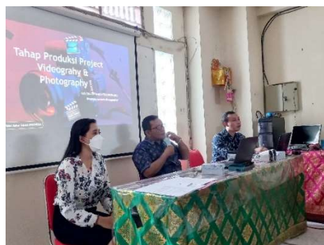
Gambar 8. Pelatihan multimedia foto dan Video