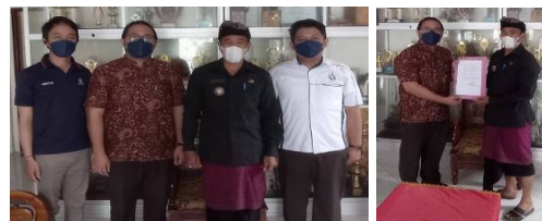
Gambar 2. Kunjungan dan Sosialisasi Kegiatan

Aplikasi Keuangan Desa (SiKuDes), Sistem Informasi Geografis (SiGadis) dan Sistem Informasi Desa (Putra, 2015; Ramadana,2010). Selain itu, dalam kepengurusan administrasi kependudukan, Desa Petang memiliki 20 unit komputer dengan dukungan infrastruktur internet sebesar 15 Mbps.