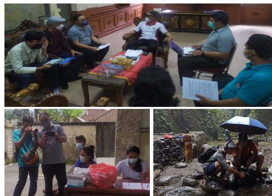
Gambar 4. Kegiatan Survey dan Pengambilan Video

Proses pengambilan Video merupakan proses perekaman kegiatan masyarakat atau perekaman video di lokasi unggulan Desa. Dari 19 lokasi yang telah ditentukan, dilakukan pengambilan video selama 3 hari. Waktu awal pengambilan video ditentukan berdasarkan lokasi perekaman kegiatan