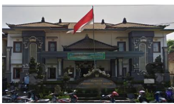
Gambar 1. Kantor Desa Petang

Menurut Undang Undang Nomor 6 tahun 2014, desa adalah kesatuan masyarakat hukum yang memiliki batas wilayah yang berwenang untuk mengatur dan mengurus urusan pemerintahan, kepentingan masyarakat setempat berdasarkan prakarsa masyarakat, hak asal usul, dan atau hak tradisional yang diakui dan dihormati dalam sistem pemerintahan NKRI (Kurniawan, 2015; Candra dkk, 2017). Desa Petang merupakan salah satu Desa tertua di daerah Badung, yang tepatnya berada di kawasan kecamatan Petang, Kabupaten Badung yang telah berdiri sejak tahun 1965.