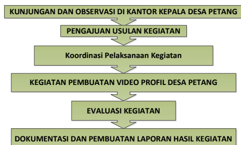
Gambar 3. Tahapan Pelaksanaan Kegiatan

profil desa. Dalam proses pembuatan video profil desa Petang, dilakukan perumusan tahapan kegiatan untuk menjelaskan setiap proses yang dilakukan selama pelaksanaan kegiatan. Susunan kegiatan yang dimaksud ditunjukkan pada Gambar 3.