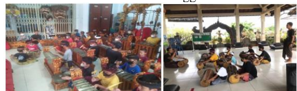
Gambar 2. Latihan Tabuh Sanggar Taksana

Terdapat dua perumusan masalah yang dihadapi oleh sanggar Taksana, pertama terkait optimalisasi digital marketing yang belum dilakukan dan kedua, minimnya kompetensi yang dimiliki pengurus Sanggar Taksana dalam pembuatan laporan keuangan. Berdasarkan