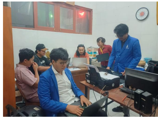
Gambar 5. Pelatihan Pembuatan Spreadsheet dan Media Sosial

Kegiatan ini diadakan di lokasi pengabdian pada tanggal 24 April 2024. Pada kegiatan tersebut dilaksanakan pelatihan penggunaan media sosial Facebook dan Tiktok sebagai media digital marketing untuk Sanggar Taksana. Pelaksanaan pelatihan dilaksanakan oleh tim pengabdian kepada 1 orang pengurus sanggar yang nantinya akan menjadi admin dari media sosial terkait.