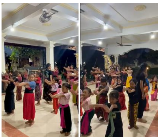
Gambar 6. Latihan Rutin Sanggar Taksana