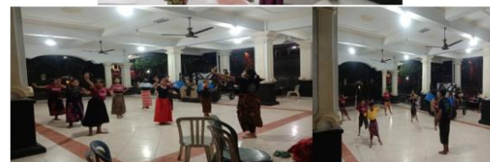
Gambar 1. Latihan Tari Sanggar Taksana